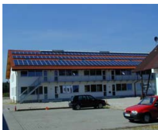
Solalinden 34 kW