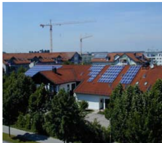
Unterhaching 27 kW